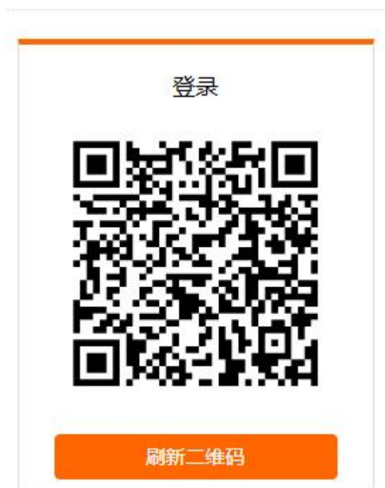
系统登录/注册界面