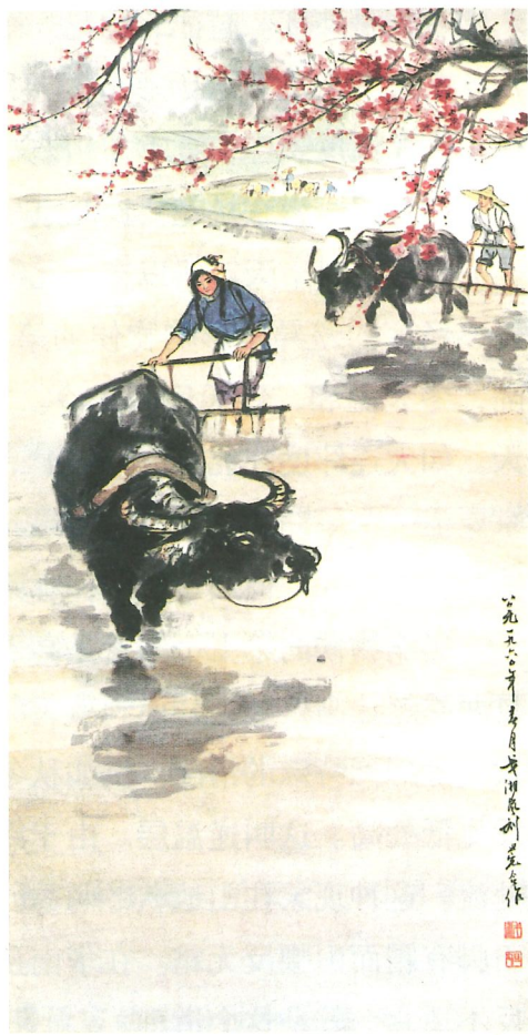
《春耕》 戈湘岚、刘旦宅作