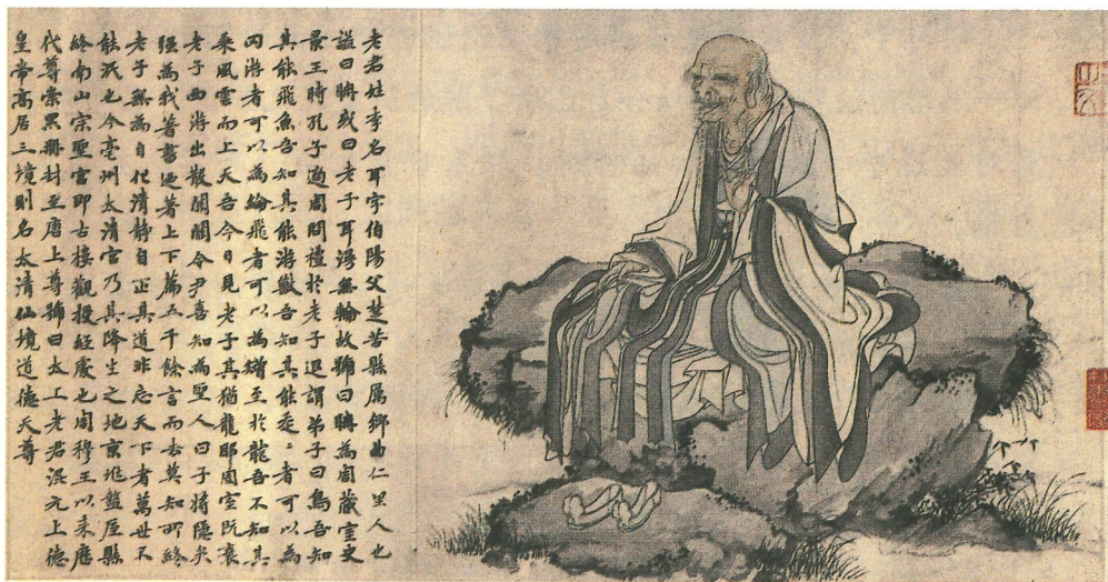
老子像 [元]华祖立 作