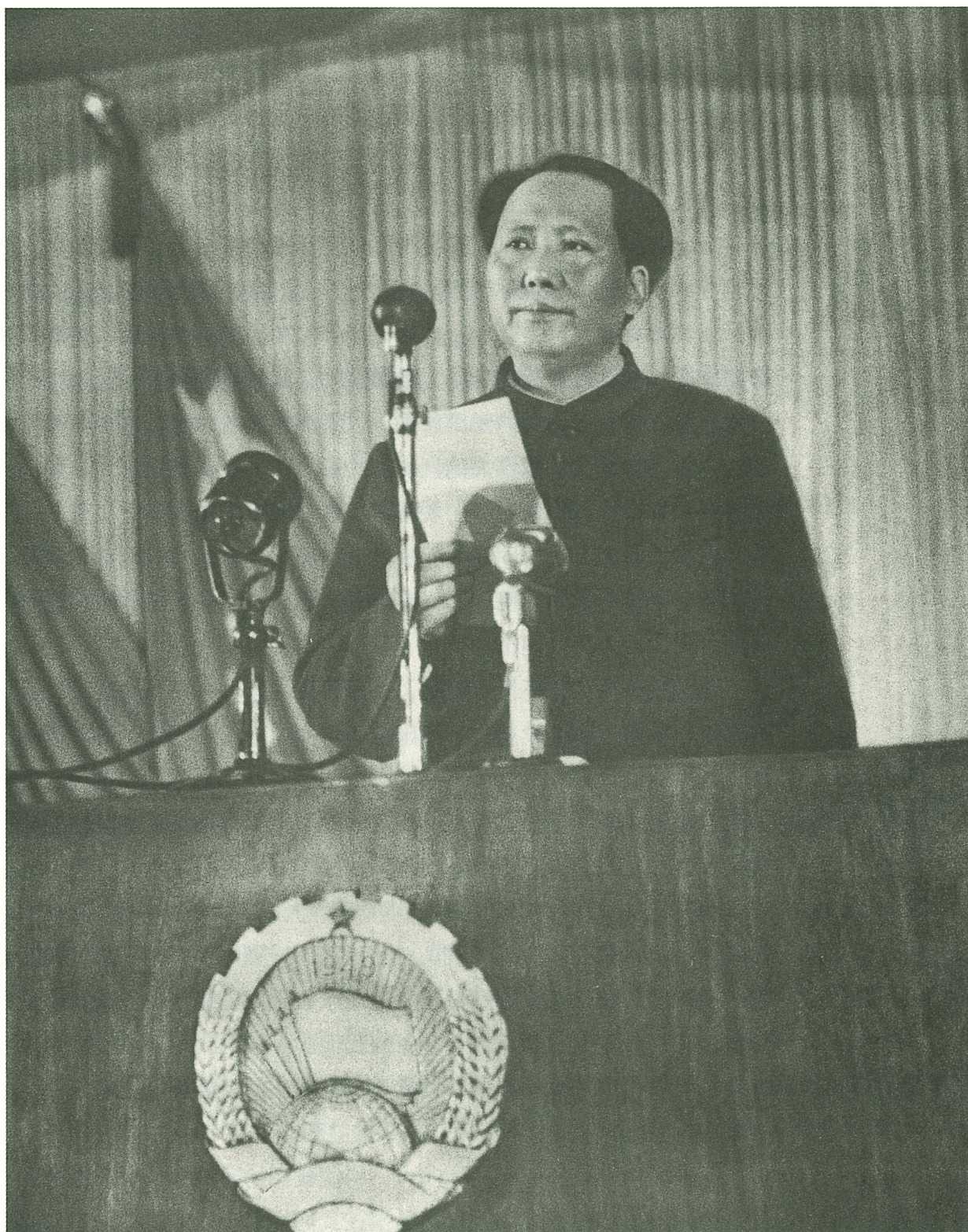
毛泽东在中国人民政治协商会议第一届全体会议上致开幕词