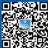
川北医学院官方微信