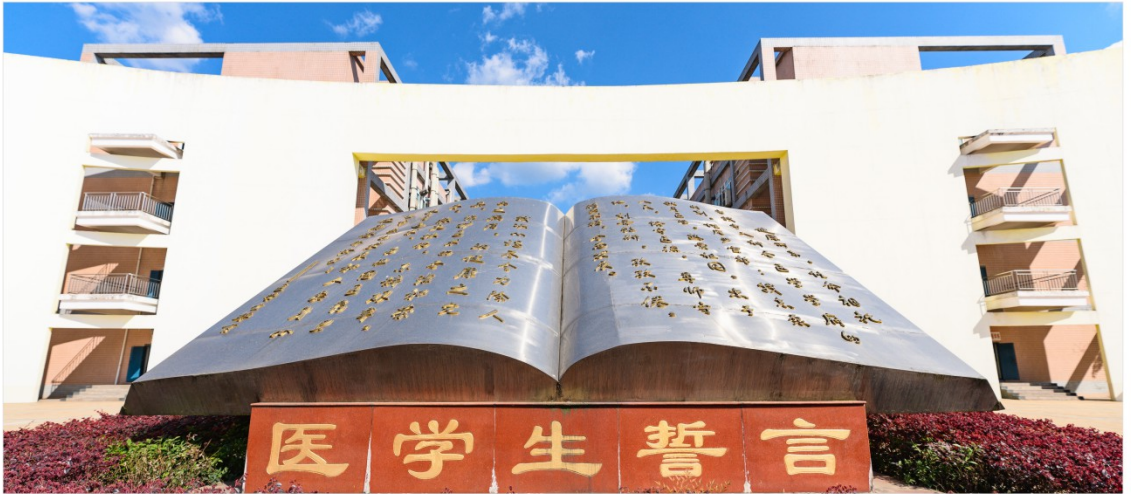
我校省部级、厅局级重点学科一览表