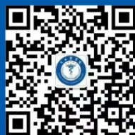
川北医学院就业服务平台