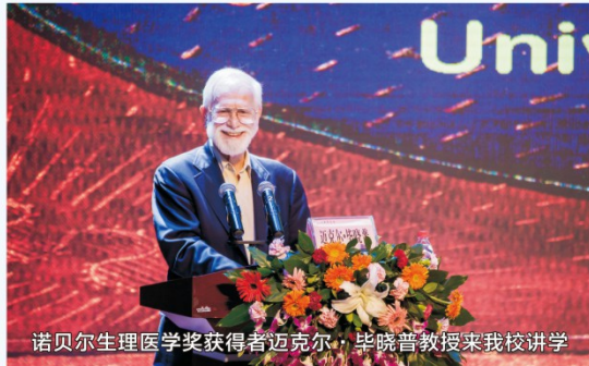
诺贝尔生理医学奖获得者迈克尔·毕晓普教授来我校讲学

川北医学院坐落在四川省南充市，现有顺庆和高坪两个校区，占地面积1000余亩。学校前身是1951年创办的西南区川北医士学校，1965年升格为专科，1985年升格为本科，定名为川北医学院。现已成为一所以医学为主体，医、文、管、法、工、教多学科协调发展的省属高等医学院校。