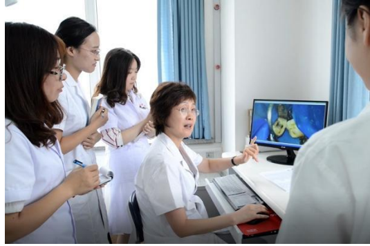
口腔颌面外科基地：