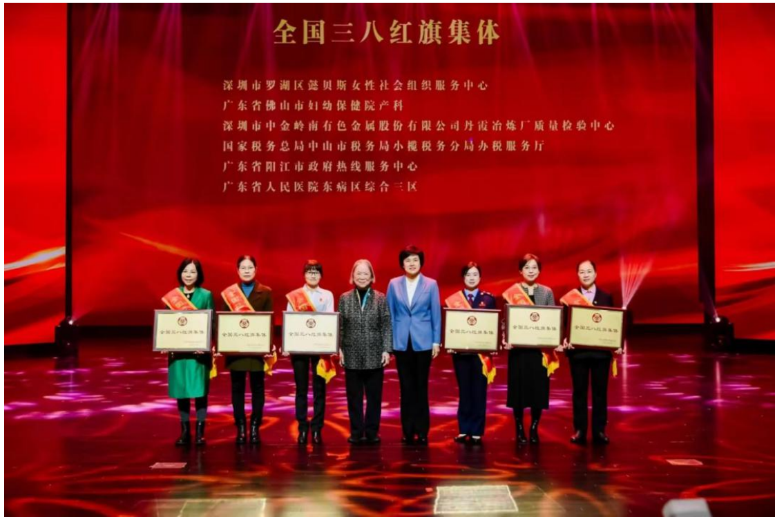
(全国三八红旗集体颁奖仪式)