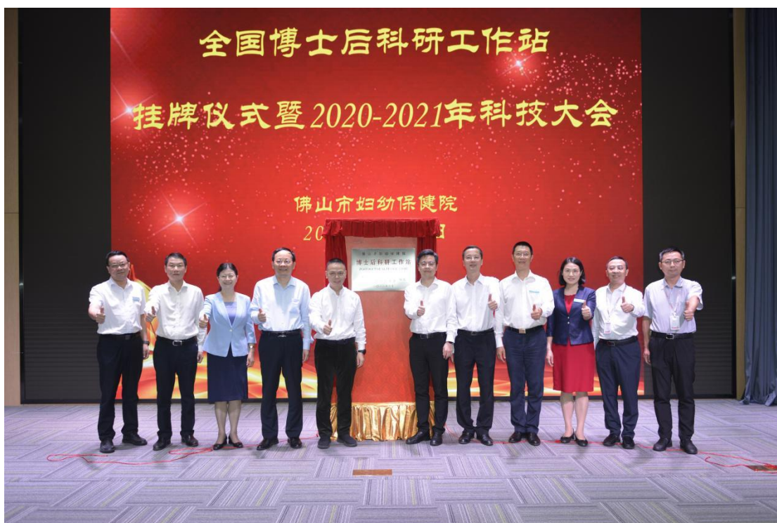
(全国博士后科研工作站挂牌仪式)