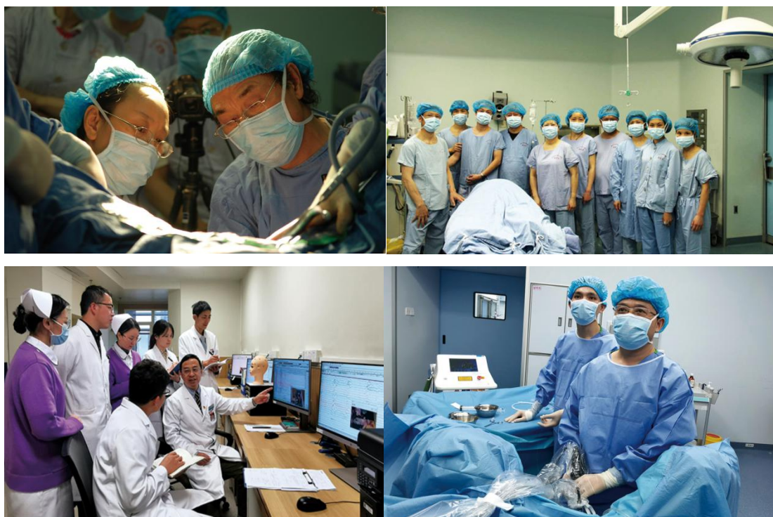
(广东省“十四五”临床重点专科：妇科、产科、儿科、儿外科)