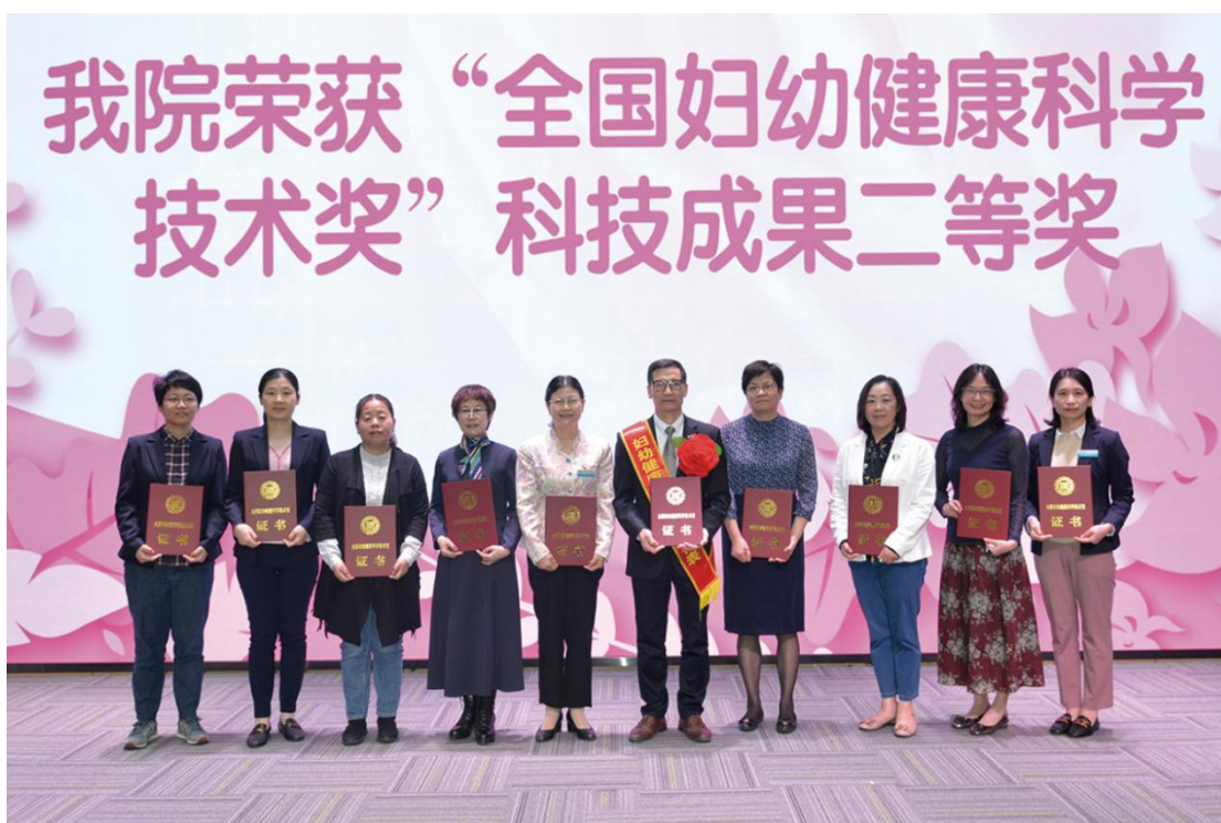
(全国妇幼健康科学技术奖二等奖颁奖仪式)