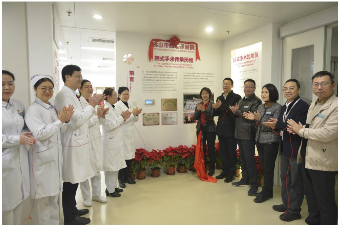
(妇科阴式手术陈列馆开馆仪式)