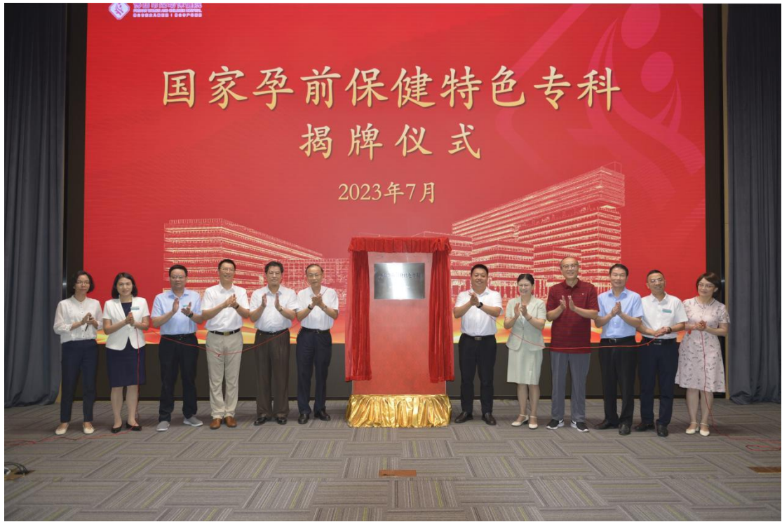
(国家孕前保健特色专科揭牌仪式)