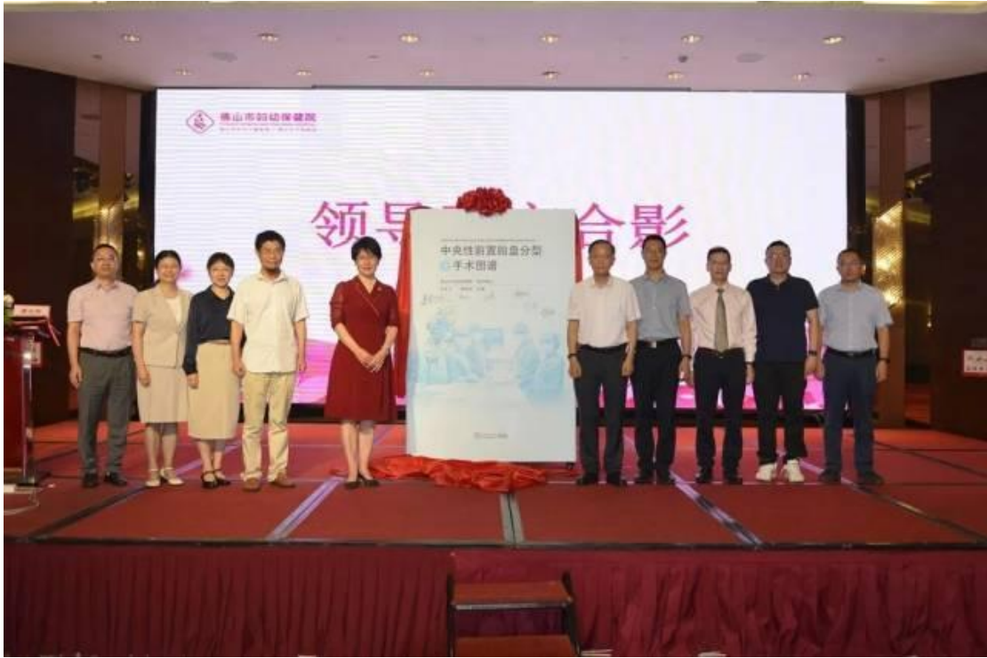
(《中央性前置胎盘分型及手术图谱》入选国家新闻出版署“十四五”发展规划项目目录)